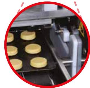
Sablé breton coupé au coupe-file