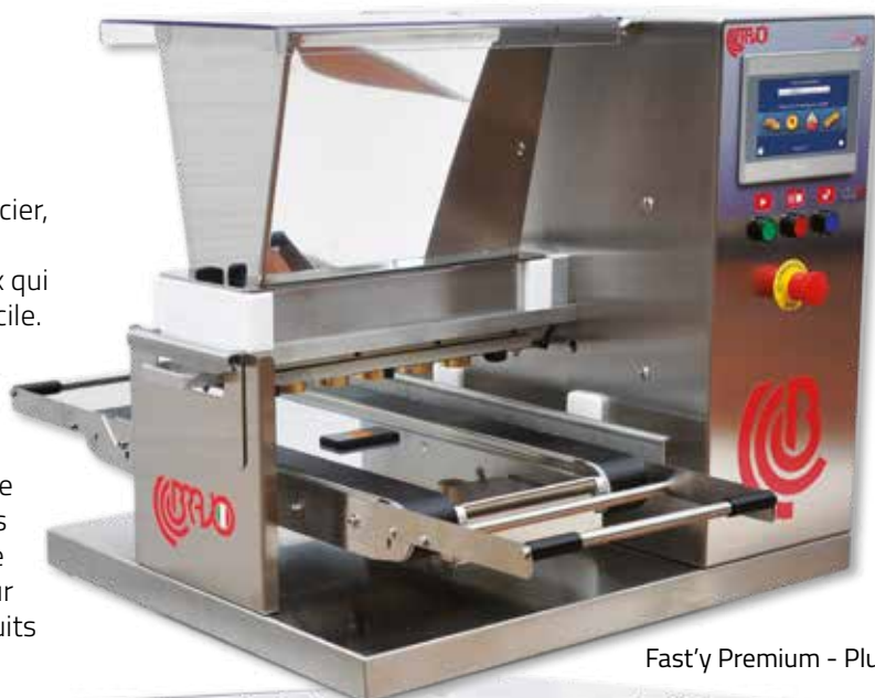
Fast'y Premium - Plus

Le tableau de commandes permet à l'opérateur de s'interfacer avec la machine à l'aide des boutons et du tableau de contrôle à écran tactile mis à disposition. Le microprocesseur peut garder stocké jusqu'à 100 recettes différentes, qui peuvent être importés et exportés via une clé USB.